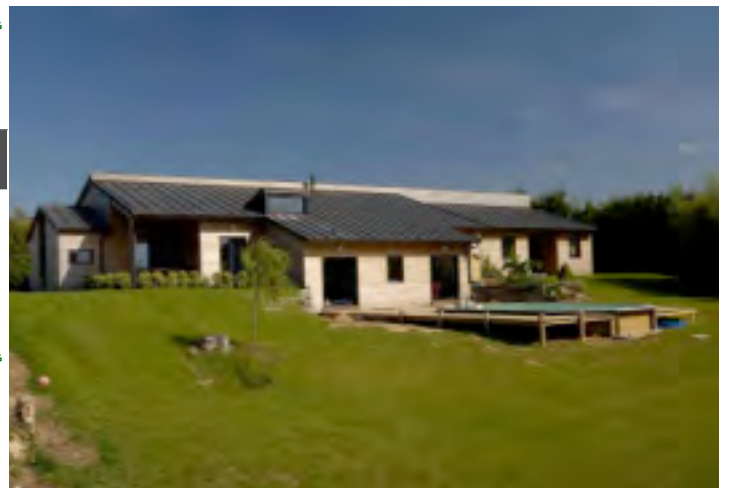
Vue générale de l'insertion harmonieuse dans le site