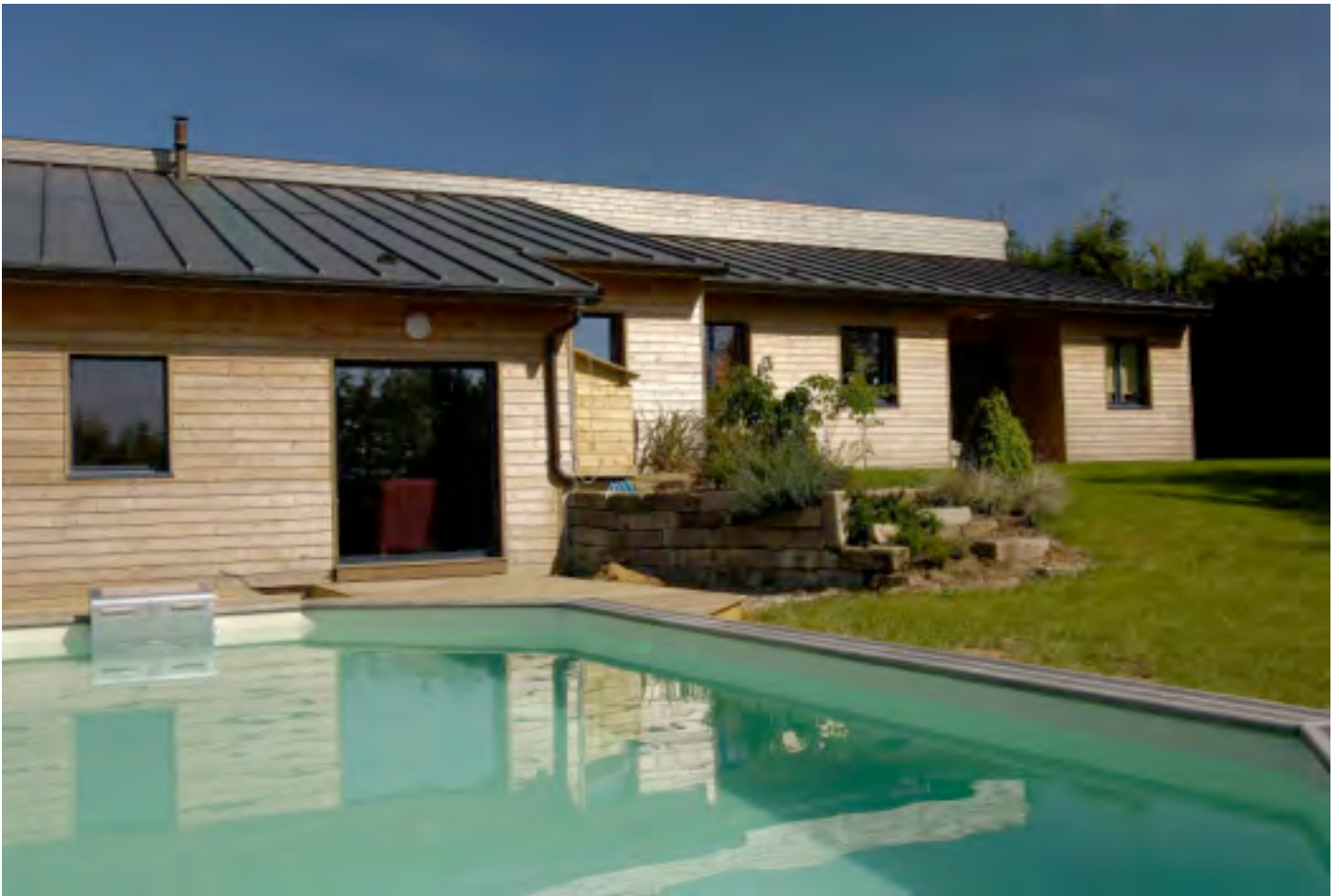
Vue sur la façade Ouest depuis la piscine